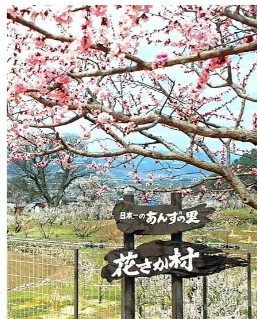
横島アプリコットファーム 展望台