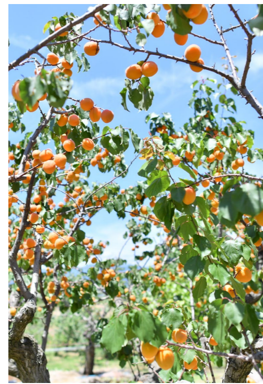
横島アプリコットファーム